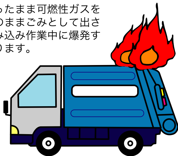
豊島区車両火災発生件数

中身の入ったまま可燃性ガスを含む物がそのままごみとして出されると、積み込み作業中に爆発することがあります。