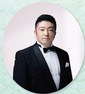
田口昌範 (テノール歌手)

会員・一般 2,000円 当日受付 ※現金のみ 子ども(高校生以下) 無料 子どもの保護者または介助者(1名まで) 無料