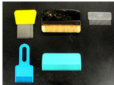
駆除のための梳き櫛