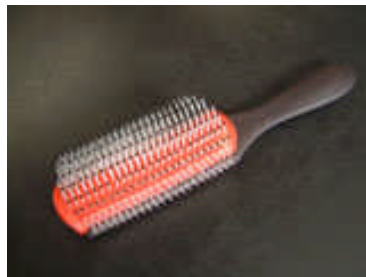
普通のブラシなど