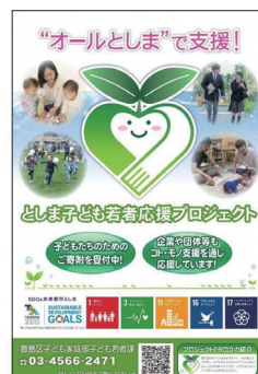
チラシ・ポスター

「としま子ども若者応援プロジェクト」のポスターやチラシ等を提供しています。子ども・若者や子育て家庭への支援を広めるため、企業や学校、地域等でご活用いただける場合は、ぜひご連絡ください。