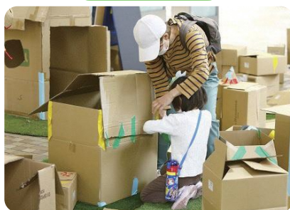
自社スペースを活用した遊び場の実施 ～居場所・体験機会の提供～