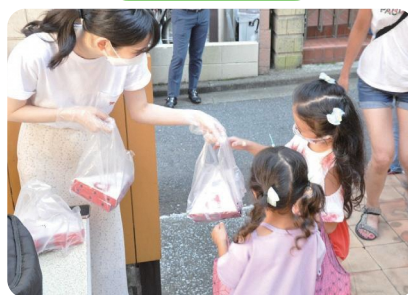
子ども食堂や家庭へ食糧等の寄附 ～食糧・生活支援～

企業や団体がつ資源や「今あるモノ」「身近なコト」が子ども・若者や子育て家庭への支援につながります！