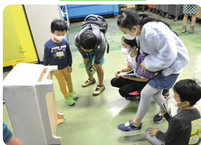
自社スペースを活用したイベントの実施 ～居場所・体験機会の提供～