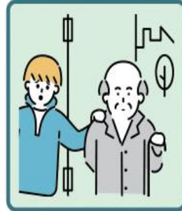
目を離せない家族の見守りや声かけなどの気づかいをしている