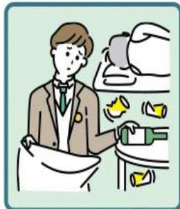
アルコール・薬物・ギャンブル問題を抱える家族に対応している