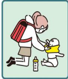
家族に代わり、幼児きょうだいの世話をしている