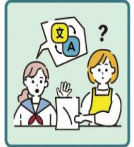
日本語が第一言語でない家族や障がいのある家族のために通訳をしている