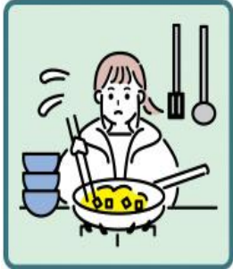
障がいや病気のある家族に代わり、買い物・料理・掃除・洗濯などの家事をしている

「ヤングケアラー」とは、本来なら大人が担うと想定されている家事や家族のお世話などを日常的におこなっていることにより、子ども自身がやりたいことができないなど、子ども自身の権利が守られていないと思われる子どものことをいいます。