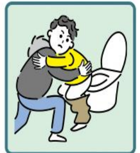
障がいや病気のある家族の入浴やトイレの介助をしている