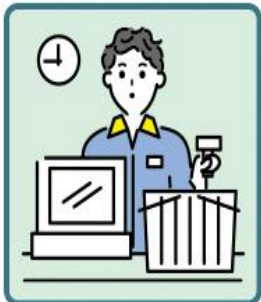
家計を支えるために労働をして、障がいや病気のある家族を助けている