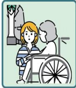
障がいや病気のあるきょうだいの世話や見守りをしている