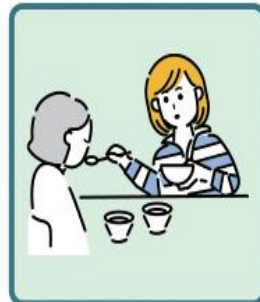
障がいや病気のある家族の身の回りの世話をしている