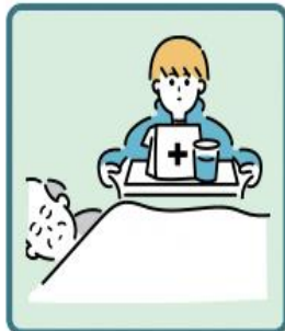
がん・難病・精神疾患など慢性的な病気の家族の看病をしている