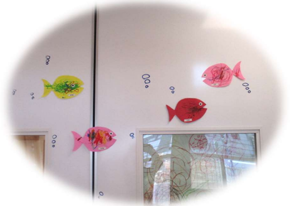
りす組 自分で好きな色の魚を選んでクレヨンでなぐり描きました。色とりどりの魚が泳いでいます🐟