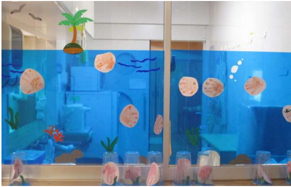
ひよこ組 子どもたちの手形をおうちの方に、魚とタコにアレンジしてもらいました。気持ちよさそうに泳いでいます！

夏本番！ 8月の保育園は夏の日差しにも負けないひまわりや魚🐟、Tシャツが彩っています。