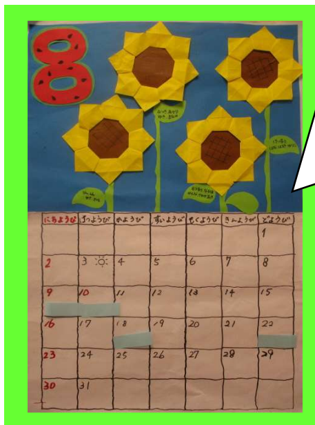
ひまわり組 8月のカレンダーはひまわり🌻 今回はグループごとに花びらを折り、大きなひまわりを4輪作りました。子どもたちから8月は「すいか」と声もあがり 8 がすいか模様になりました！