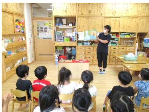
絵本を読んでいるところ

絵本を読んだ後、子どもたちからいろいろな感想が聞かれました。 ・ごみはごみ箱に捨てたほうがいい。 ・川の赤ちゃんが泥だらけで、くさくなってかわいそうだった。 ・海がよごれて海のみんなが泣いていてかわいそう。 ・ごみを拾ったりしていたから、もったいないばあさんは正しかった。