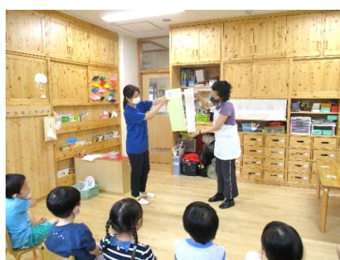
トイレットペーパーの長さ