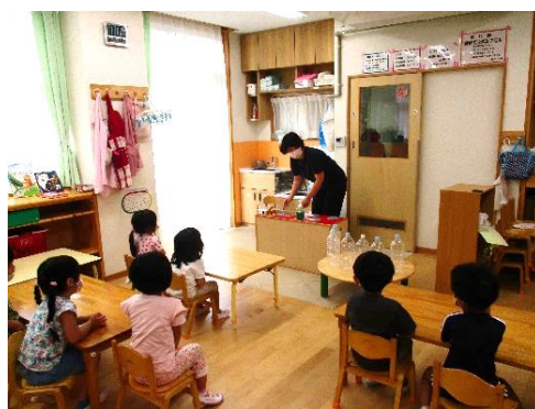
水を出したままの手洗い

1分間、水道の水を出し続けると、2リットルのペットボトルも本分の水をむだにしてしまうことを知りました。「わーもったいない」と、実際のペットボトルを見て、子ども達から驚きの声が聞かれました。