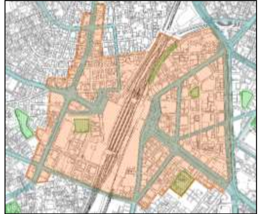
図1. アンケート配布対象範囲