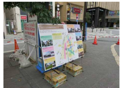
中池袋公園パネルの設置状況