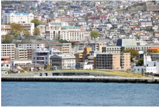
▲（取組 1-①、1-④ 長崎市・長崎港松が枝国際観光船埠頭）

隣接する公園から連続する緩やかな緑の地形とすることで周囲の景観に溶け込むデザインとなっている。高さを抑えることで、港への眺望を確保するとともに、屋上庭園を開放し、新たな視点場を創出している。