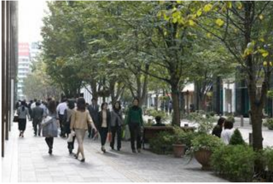
▲（取組 1-①、1-④ 横浜市）

ケヤキ、シナノキ、アメリカフウ、カツラなど多様な樹種で、線状の空間を強調する街路樹ではなく、庭的な空間を作り出し、四季の変化を演出している。