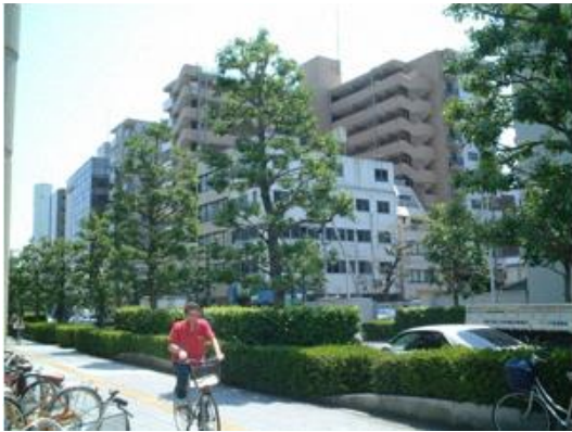
▲（取組 1-①、1-④ 横浜市）

ケヤキ、シナノキ、アメリカフウ、カツラなど多様な樹種で、線状の空間を強調する街路樹ではなく、庭的な空間を作り出し、四季の変化を演出している。