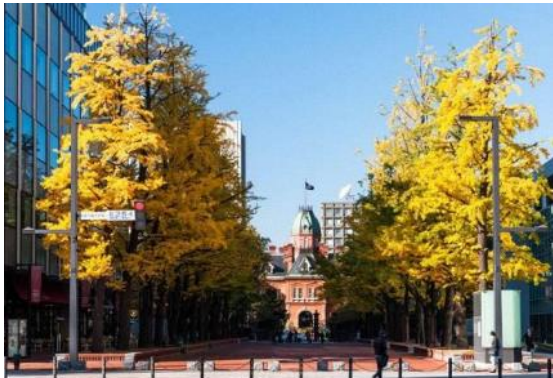
▲（取組 2-①、2-⑤ 札幌市・北三条広場）

外壁は、落ち着いた色彩で周辺との調和を図り、目白通りの銀杏並木に溶け込むデザインとなっている。また、通りに面したバルコニーを壁面緑化することで、目の前の学習院大学のみどりとの連続性を形成している。