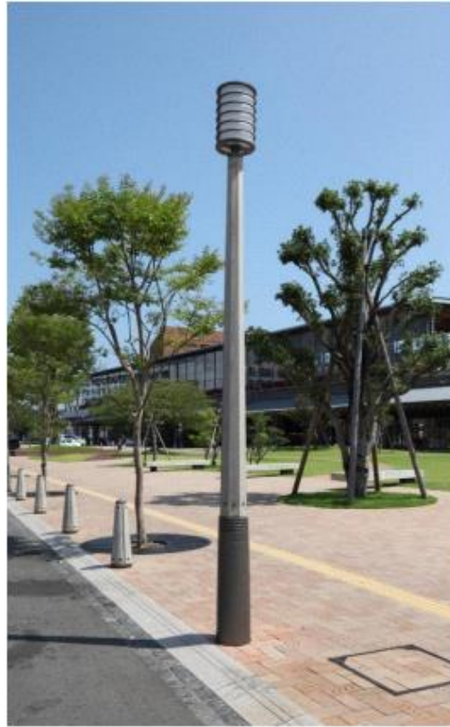
▲（取組 1-② 日向市・日向駅）

せん定頻度を高め樹木へのダメージ減らすと共に、周辺の状況や樹種に応じて、樹形や選定方法を定め、計画的な維持管理が行われ、美しい並木と街並みが形成されている。