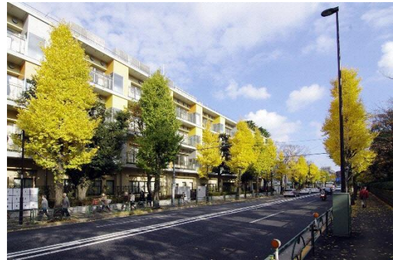
▲（取組 1-①、1-② 豊島区・目白小学校）

隣接する公園から連続する緩やかな緑の地形とすることで周囲の景観に溶け込むデザインとなっている。高さを抑えることで、港への眺望を確保するとともに、屋上庭園を開放し、新たな視点場を創出している。