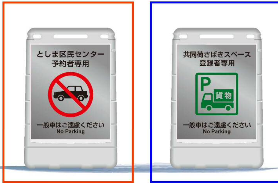
図－1 共同荷さばきスペース駐車許可証（例）

発行元：南北区道周辺荷さばきルール策定協議会 事務局：豊島区都市整備部都市計画課