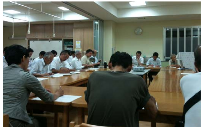
〈全体まちづくり検討会の様子〉