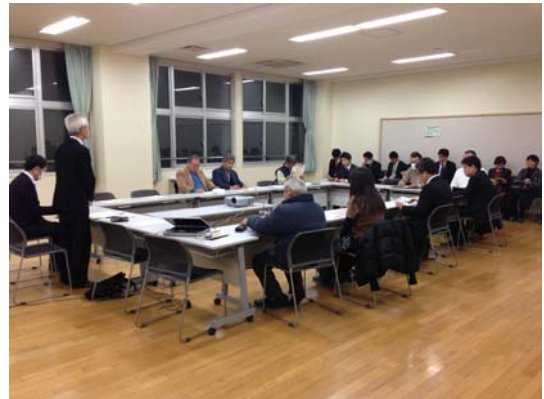
〈全体まちづくり検討会の様子〉

検討会では、南池袋二丁目A地区の進行状況について豊島区から報告がありました。その後、C地区の地権者によるまちづくりの進行状況について地権者から報告があり、参加者間で意見交換を行いました。