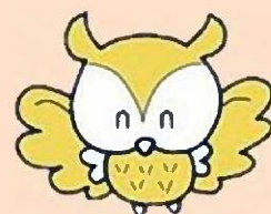
豊島区PRキャラクター「としま ななまる」