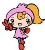
豊島区民協キャラクター「ふくみん」

主 催： 豊島区 豊島区民社会福祉協議会 共 催： (公社)豊島区医師会 (公社)東京都豊島区歯科医師会 (公社)豊島区薬剤師会 (公社)豊島区シルバー人材センター 協力団体： 東京巣鴨ライオンズクラブ 東京池袋ライオンズクラブ 豊島区民生委員児童委員協議会 和光市社会福祉協議会等