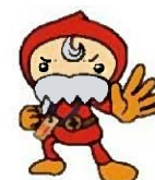
豊島区民協キャラクター「ふくじい」

主 催： 豊島区 豊島区民社会福祉協議会 共 催： (公社)豊島区医師会 (公社)東京都豊島区歯科医師会 (公社)豊島区薬剤師会 (公社)豊島区シルバー人材センター 協力団体： 東京巣鴨ライオンズクラブ 東京池袋ライオンズクラブ 豊島区民生委員児童委員協議会 和光市社会福祉協議会等