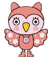
豊島区PRキャラクター 「そめふくちゃん」

中池袋公園会場の イベントにつきましては 荒天時は中断もしくは 中止とさせていただきます。 場合がございます。