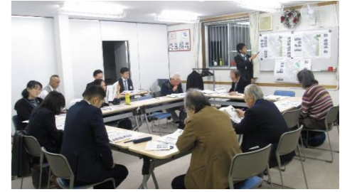
(区民ひろば朝日にて)