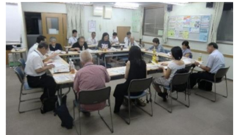
第2回防災まちづくりの会の様子 (区民ひろば朝日にて)

まちを点検する際には「阻害要素」「不足要素」「保全要素」は何か、という視点を持ってまち歩きを行うことにしました。そして、委員のみなさんの視点から浮かびあがった巣鴨五丁目内の課題を整理したうえで、本会の検討テーマを決めることにしました。