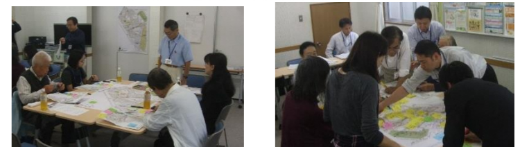
点検マップの発表