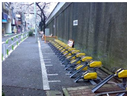
従前の大塚駅北口第二自転車駐車場