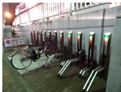
コイン式ラック改修後の大塚駅北口第二自転車駐車場