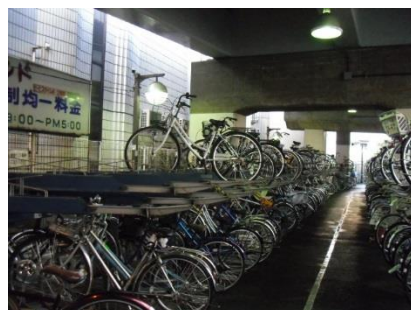
従前の池袋駅北自転車駐車場