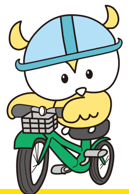
豊島区マスコット 「ななまる」