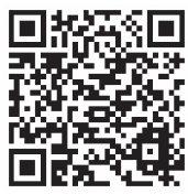
▲アシスとおはなし (小学生向け)

家庭や学校以外で子ども本人がお話しできる場所として、アシスとしまをご活用ください。