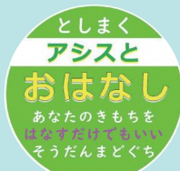
▲アシスとおはなし (中学生・10代の方向け)