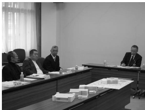
模型を用いて校舎の配置案を 説明しました