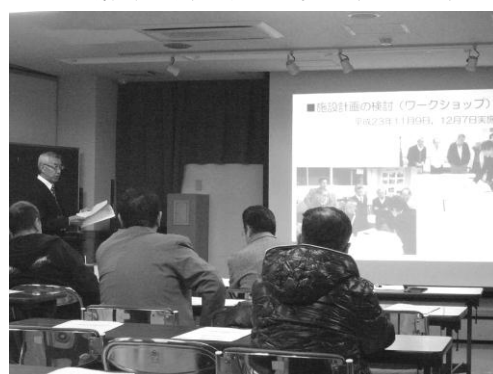
地域説明会(平成 24 年 1 月 31 日)