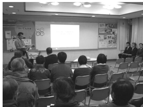
町会説明会(平成 23 年 12 月 16 日)