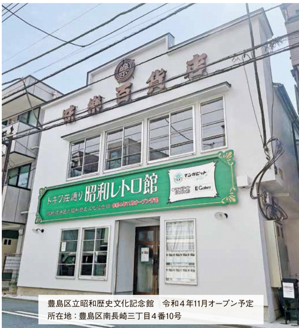
豊島区立昭和歴史文化記念館 令和4年11月オープン予定 所在地：豊島区南長崎三丁目4番10号

令和4年第2回定例会は、6月8日から7月15日までの38日間にわたって開会されました。