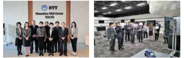
視察風景(NTT武蔵野研究開発センタ)