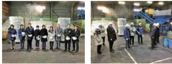
視察風景(株式会社トベ商事足立営業所)