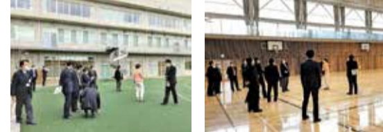
視察風景(北区立浮間中学校)