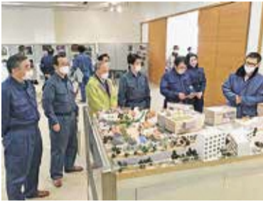
視察風景 (神田川・環状七号線地下調節池)