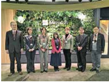
視察風景 (日本マイクロソフト株式会社)