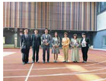
視察風景 (中央区立城東小学校)