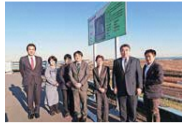
視察風景 (東京都廃棄物埋立処分場)