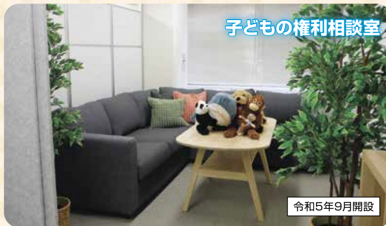
子どもの権利相談室