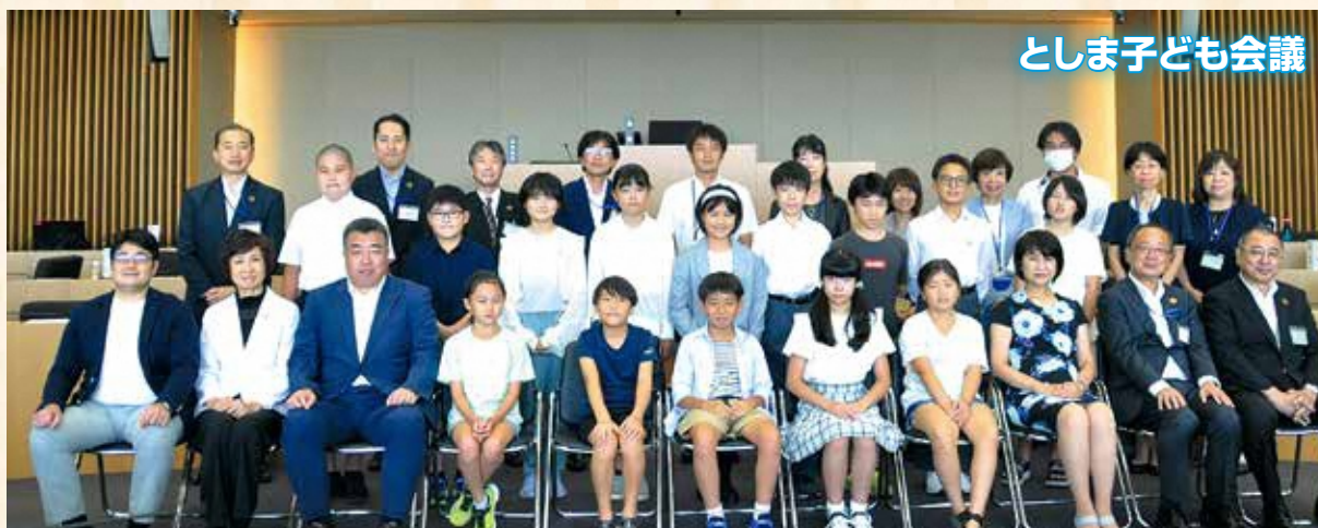
としま子ども会議