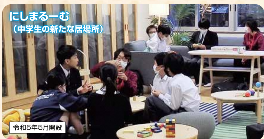
にしまる一む (中学生の新たな居場所)