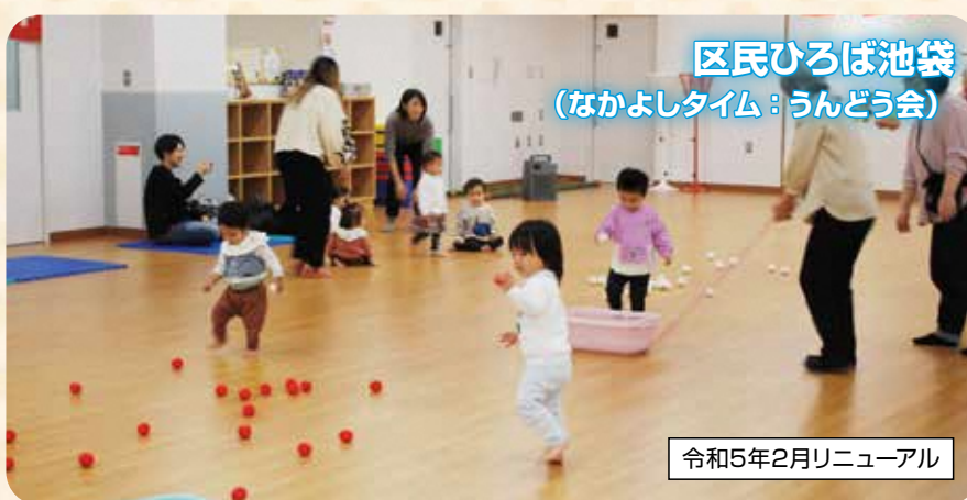
区民ひろば池袋 (なかよタイム：うんどう会)