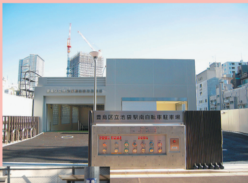
池袋駅南自転車駐車場