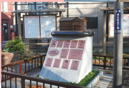
「トキワ荘のヒーローたち」 記念碑