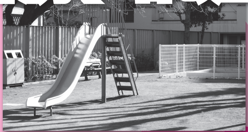
4月1日より東池袋青空公園になります

豊島区立地域文化創造館の指定管理者 公益財団法人としま未来文化財団 (駒込・柴鴨・南大塚・雑司が谷・千早地域文化創造館) 豊島区立体育施設の指定管理者 コナミスポーツ&ライフ・近鉄ビルサービスグループ (雑司が谷体育館)