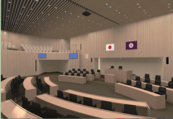
▲新庁舎議場のイメージ