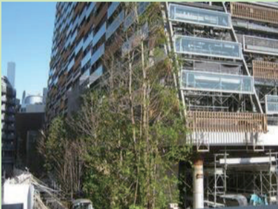
▲新庁舎外構西側植栽