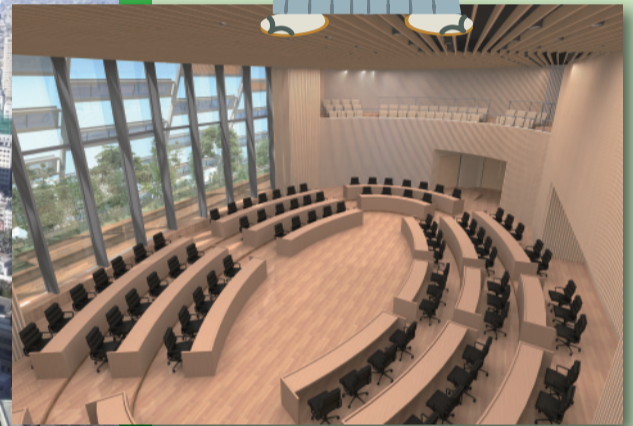
▲新庁舎議場の活用イメージ