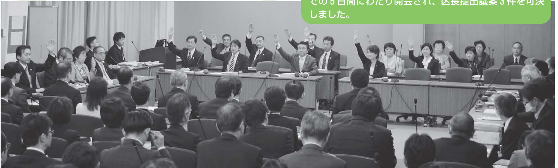
予算特別委員会の様子

また、平成27年第1回臨時会は3月27日から31日までの5日間にわたり開会され、区長提出議案3件を可決しました。