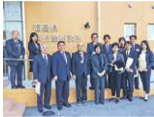
視察風景(福島県浜児童相談所)