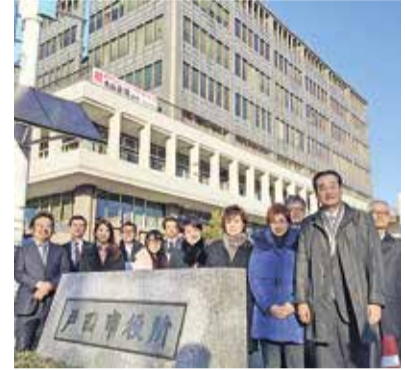
視察風景(戸田市役所)