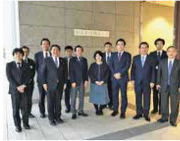
視察風景(呉市役所)