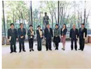
視察風景(宮城県庁)