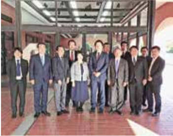
視察風景(倉敷市役所)