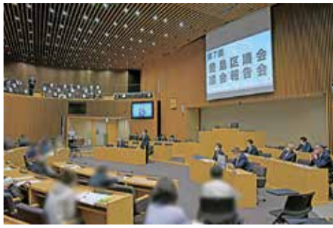
議会報告会の様子

令和4年5月14日(土)に第7回議会報告会を開催し、37名の方にご参加いただきました。今回の議会報告会は、普段なかなか入ることができない本会議場(区役所8階)に区民の方をお招きし、開催しました。また、当日はインターネットにてライブ中継も行いました。 議会報告会は、議会活動に関する情報を区民の皆様に説明するとともに、議会としての意思