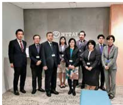
字幕表示について、NTTアドバンステクノロジー株式会社を視察

現在は、委員会のライブ中継の対象拡大等、更なる情報公開の推進や、議会中継における字幕表示の導入等について協議を行っています。今後も、より一層わかりやすい議会運営を目指して改革を進めていきます。