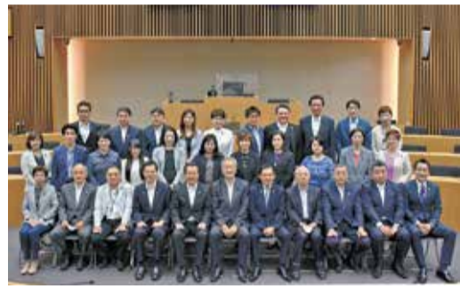
議会報告会集合写真