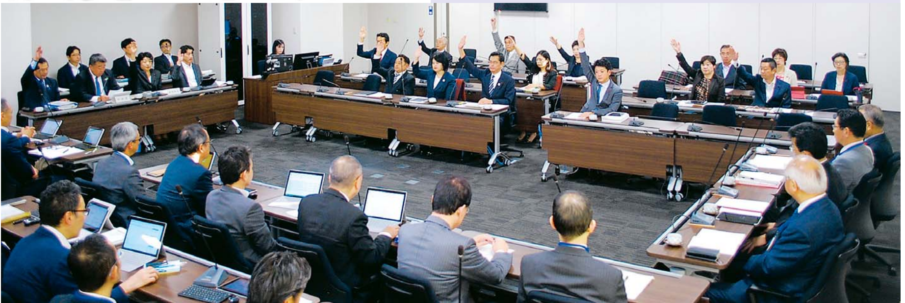
決算特別委員会の様子

請願・陳情は、2件を採択、3件を不採択、新たに4件を閉会中の継続審査としました。