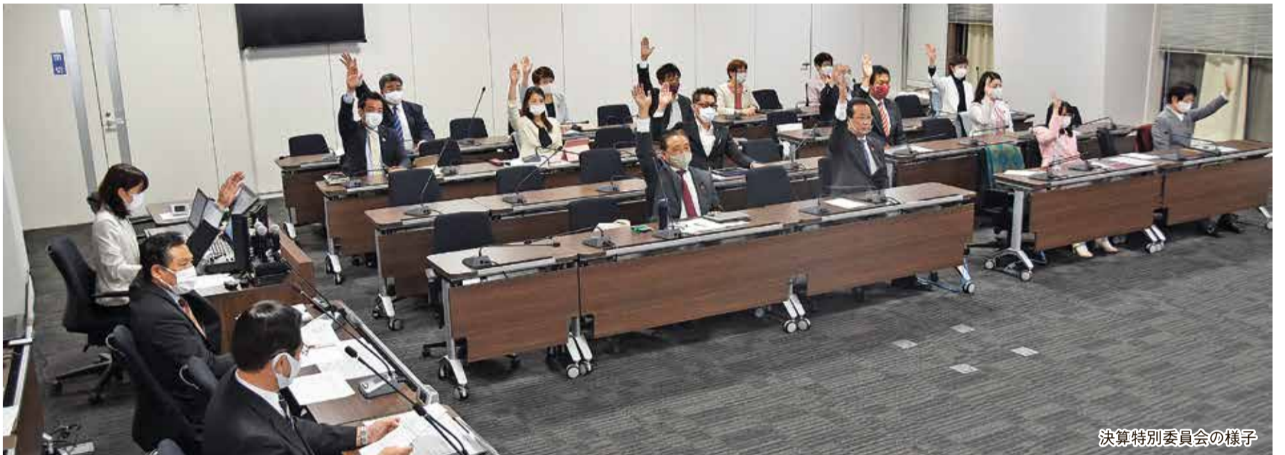
決算特別委員会の様子