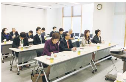
視察風景（横須賀市児童相談所）