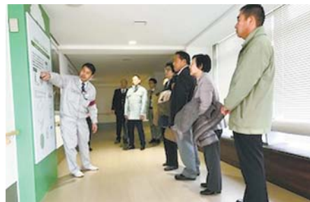
視察風景（練馬清掃工場）