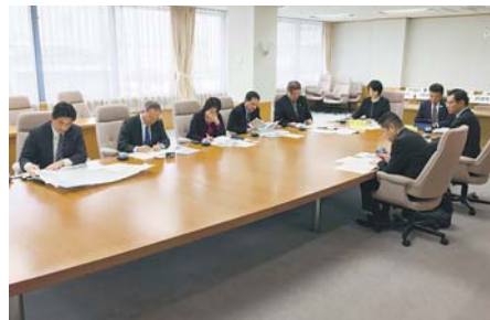
視察風景（大分県庁）