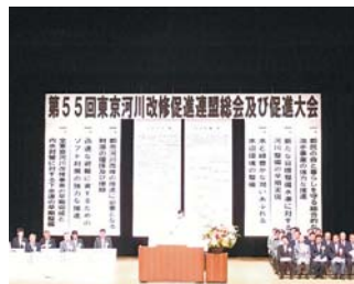
河川改修促進大会

都内の14区21市2町1村が加盟する東京河川改修促進連盟の第55回総会及び促進大会が7月14日、調布市グリーンホールで開催され、議長及び議員17名並びに区の関係者が参加しました。大会では東京全域の治水対策の促進を要望する宣言と、治水事業の強力な推進等を要望する決議を行いました。