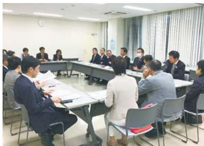
視察風景（東京都江東児童相談所）