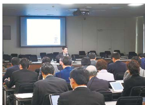
新公会計制度議員研修会

豊島区議会では、平成29年12月8日に「新公会計制度について」の議員研修会を実施しました。新公会計制度導入の意義や財務書類の活用、公会計情報の活用に向けた議会の役割等について、公認会計士の講師による説明を受けました。