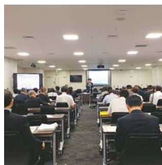
財務書類議員研修会

豊島区議会では、平成30年9月6日に「財務書類について」の議員研修会を実施しました。新公会計制度について、貸借対照表、行政コスト計算書、純資産変動計算書、資金収支(キャッシュフロー)計算書の財務書類四表等、講師より説明を受け、さらなる理解を深めました。