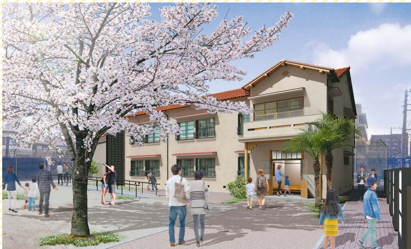
(仮称) マンガの聖地としまミュージアムイメージ ※トキワ荘の外観に加え、玄関、階段、共同炊事場、 便所、マンガ家の居室を再現したマンガ・アニメ ミュージアムを2020年3月整備予定。(南長崎花 咲公園内・南長崎三丁目9番22号)

平成30年第4回定例会は、11月20日から12月10日までの21日間にわたって開会されました。