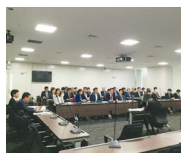
ハラスメント防止対策議員研修会

豊島区議会では、あらゆるハラスメントを排除し、ハラスメント防止のための対策を講じることを決議しています。平成30年12月18日には、「ハラスメント防止」の議員研修会を開催し、ハラスメント問題の本質や予防法等について講師より学びました。