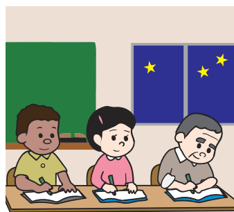
多様な学びの場、確保を！

国の計画で「多様なニーズに対応した教育機会の提供、夜間中学の設置・充実」を掲げている。調査実施の方向で考える。