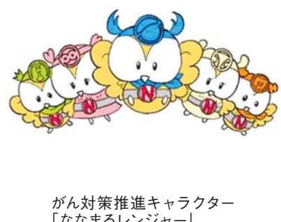
がん対策推進キャラクター「ななまるレンジャー」