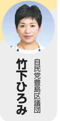
自民党豊島区議員 竹下ひろみ