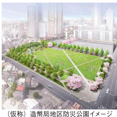
(仮称) 造幣局地区防災公園イメージ

答 日常の案内は各事業者が行うが、混雑緩和や緊急時に備えた避難誘導は、各管理者及びエリアマネジメントが合同の会議体等を組織し、安全安心なイベント等を立案実践する。帰宅困難者対策は、建物を活用する協定の締結に向けた協議を行っている。合同避難訓練も、11月に立ち上げる協議会の組織化の過程で積極的に検討する。