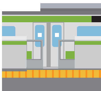
ホームドア、点字ブロックの設置された駅のホーム