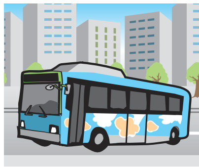
コミュニティバス

については 問 区民の要望に応え、具体的に検討状況を示し、早急にコミュニティバスを運行すべき。 答 電気バス計画を進める中で、課題解決の時間が必要。現時点で早急に導入する考えはない。 問 (再質問) 区長は区民の願いに応え、コミュニティバスを走らせる方向で考えているのか。 答 コミュニティバスを走らせる方向で考えている。