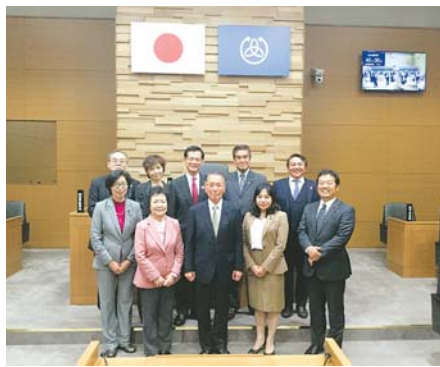
視察風景（女川町役場）

【開会日】 5月28日・6月7日・7月12日・9月5日・12月6日・1月10日・3月26日 【付託事項】 防災拠点、避難路、避難場所等に関する調査 【調査項目】 ①災害予防対策に関する諸課題 ②災害応急対策に関する諸課題 ③東日本大震災・平成28年熊本地震等に関する諸課題 ④その他関連事項