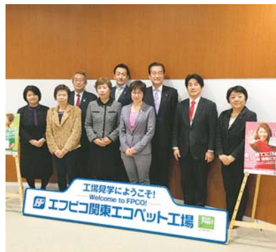
視察風景（株式会社エフピコ関東エコベットの工場）