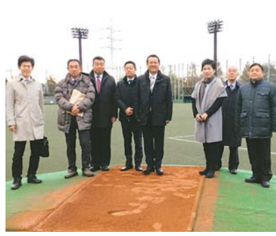
視察風景（杉並区下高井戸運動場）