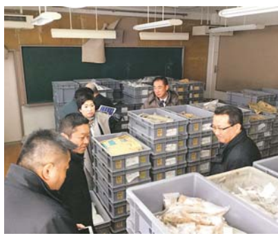
視察風景（旧第十中学校跡地）

【開会日】 5月28日・6月5日・7月11日・9月6日・11月6日・12月12日・1月9日・3月27日 【付託事項】 学校跡地、公共施設及び公共用地のあり方に関する調査 【調査項目】 ①公共施設の再構築等に関する諸課題 ②施設・用地の有効活用に関する諸課題 ③その他関連事項