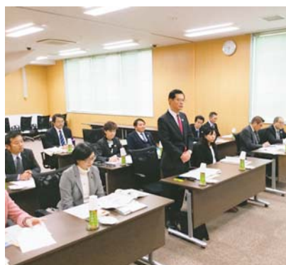
視察風景（石巻市役所）