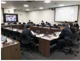
リモートによる行政調査(神戸市)