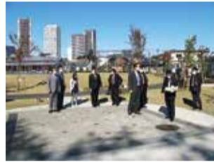
視察風景(雑司が谷公園)