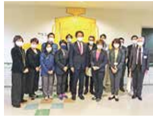
視察風景(豊島清掃工場)