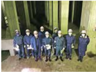
視察風景(東池袋雨水調整池)