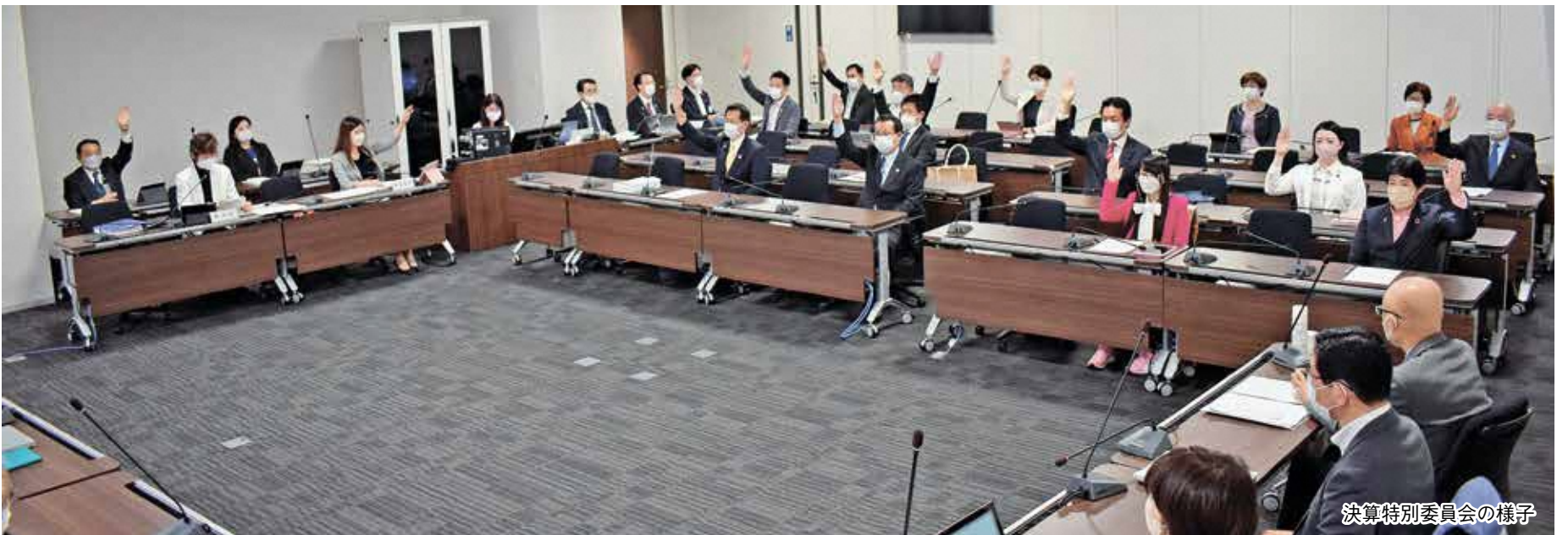
決算特別委員会の様子