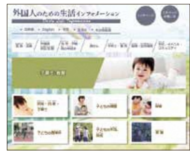
外国人のための生活インフォメーション (区ホームページより)

大人用紙おむつ、子供用紙おむつ、大人用尿取りパッド、生理用品の備蓄数と数量の根拠は。