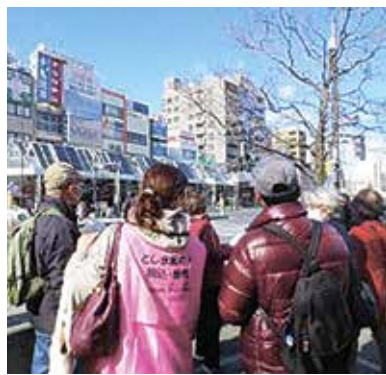
としま案内人駒込・巣鴨