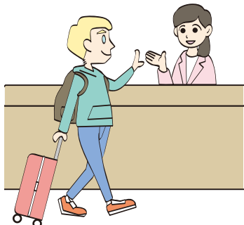
多言語の情報発信機能

多言語の情報発信機能を充実させるとともに、池袋を訪れた人たちが個性的な各地域の回遊を促進する手法を検討する。