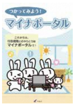
つかってみよう！マイナポータル