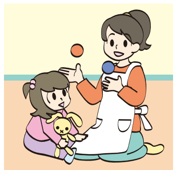
保育士の待遇改善

●令和2年度予算について 問 消費税増税の影響や景気の先行き不安等により、区財政にとつてマイナスのトレンドも考えられる。この先の歳入の見通しが甘いと考えるが、見解は。 答 確定的な見通しを持つことは困難。直近の実績に基づいて見直しを立てざるを得ない。 問 区長の招集挨拶・所信表明で「稼げる自治体としての新たな歳入の確保にも努める」と述べているが、どういうことか。 答 公民が連携しながらまちづくりを推進し、まちの魅力や価値を高めていくことで、区立芸術文化劇場のネーミングライツ等、新たな歳入を確保する。