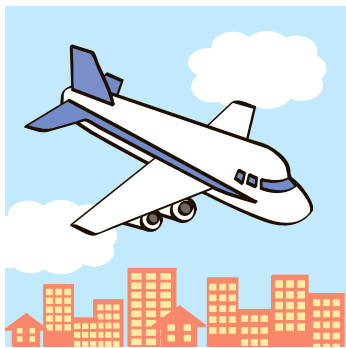
豊島区上空低空飛行ルート

区独自の騒音測定をすべき。区内で最も低く飛行する経路の下にある南長崎第二保育園の屋上での計測を計画しており、測定時期や広報の方法等を検討