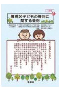
「豊島区子どもの権利に関する条例」リーフレット(一般用)

保育園の園庭に指定されている公園については、入札ルールの見直しを行い、早期に契約締結をすべきと考えるが。