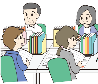
スクール・サポート・スタッフ

会が率先して遂行すべきだが。 答 校務支援システムの導入やサポート・スタッフの配置などに取り組んでおり、今後も働き方改革をリードしながら推進。 問 スクールロイヤールに不足が生じた場合の対応とスクールロイヤールワーカーの各校配置計画は。 答 弁護士1名の委託契約、スクールロイヤールワーカーは全校6名体制で、当面は十分対応可能と考えている。 問 スクール・サポート・スタッフの配置事業の効果、教員の負担軽減の数値目標及び子どもに対する影響の具体的シミュレーションを提示すべき。 答 授業で使う学習プリントの印刷・配付の準備の補助等を担い、特に資格要件はない。他の取組の効果を含め年間超過勤務削減目標は17時間。教員が子どもに向き合う時間などが増加。