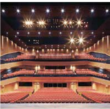
区立芸術文化劇場

い人から保険証を取り上げる資格証や短期証はやめるべき。 答 相談業務による滞納整理に取り組むことで、資格証、短期証の交付を減少させていきたい。 ●健康施策について 問 聴覚検査の年齢拡大について区の見解を問う。また補聴器について購入補助金額の増額等を検討すべき。 答 対象年齢の拡大は現時点で考えていない。補聴器購入費助成は妥当な金額と考える。