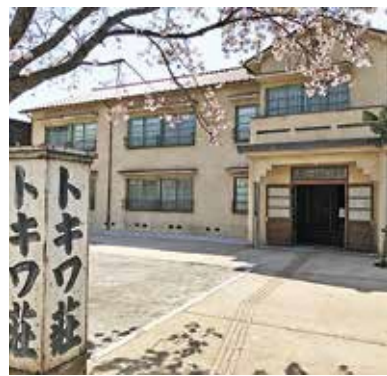
トキワ荘マンガミュージアム

肺がんCT検査は希望者が多く、予約が取れない。区はあらゆる方策を講じ、直ちに低線量CT検査ができるよう対応を。検診枠の増設とともに低線量CT等、新機器導入の可能性も、調査・研究していく。