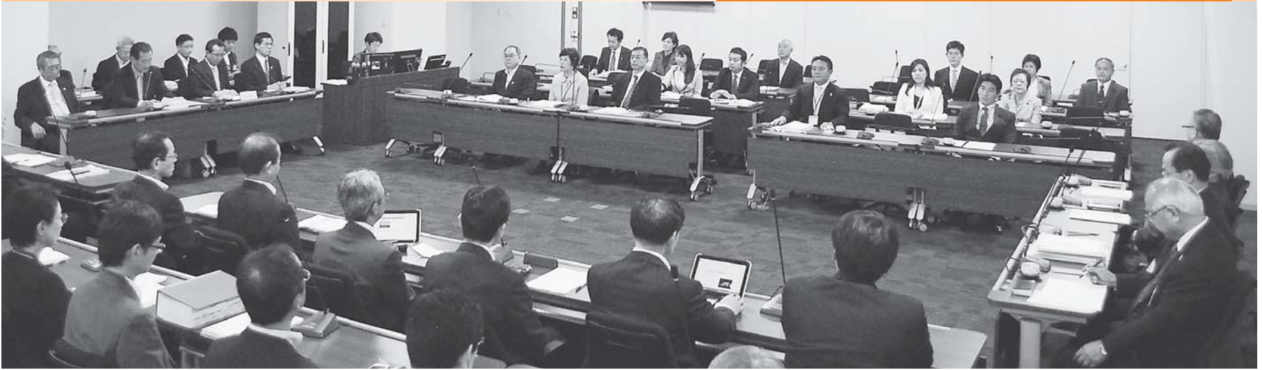
決算特別委員会の様子