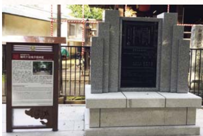
鬼子母神堂 重要文化財指定