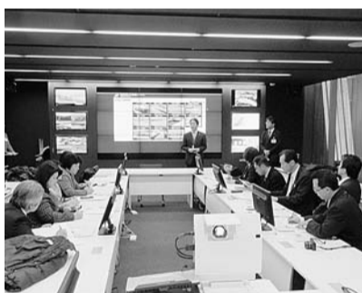
長岡市危機管理防災本部視察