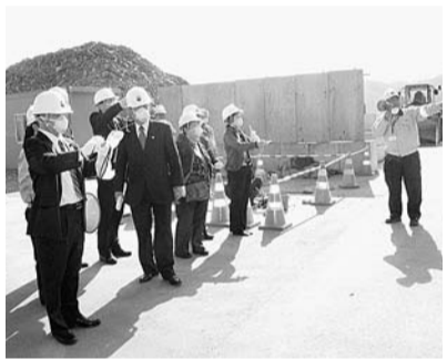
宮城県女川町視察