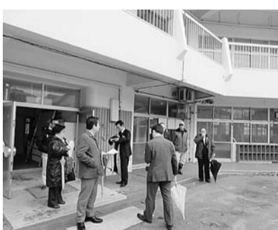
駒込第一保育園視察