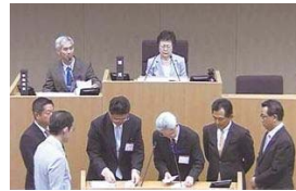
議長選挙の開票風景

5月25日の本会議では、選挙により議長・副議長を選出し、常任委員・議会運営委員の選任を行い、特別委員会設置に関する動議5件を全会一致で可決した後、特別委員の選任を行いました。 次に、区長から提出された専決処分の報告を了承しました。 また、東京都後期高齢者医療広域連合議会議員選挙の候補者の推薦については、選挙により候補者を決定しました。さらに、区長から提出された議員選出監査委員の選任についての議案を賛成多数で可決しました。