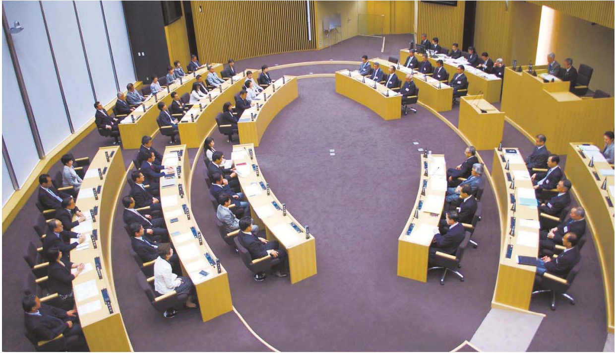
議長決定後の議場風景

http://www.city.toshima.lg.jp/kugikai E-mail A0028903@city.toshima.lg.jp