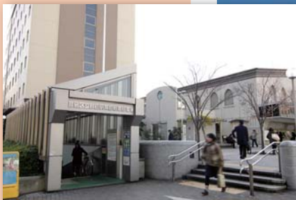
目白駅東自転車駐車場