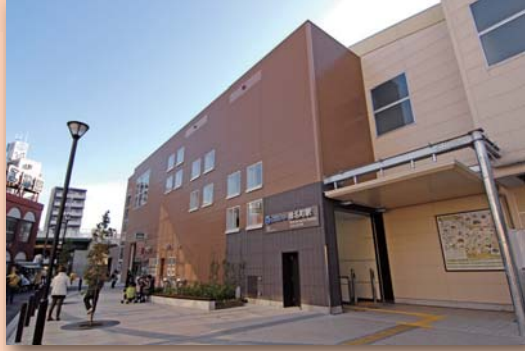
西武池袋線椎名町駅