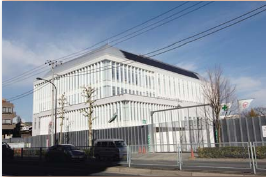
南長崎スポーツセンター