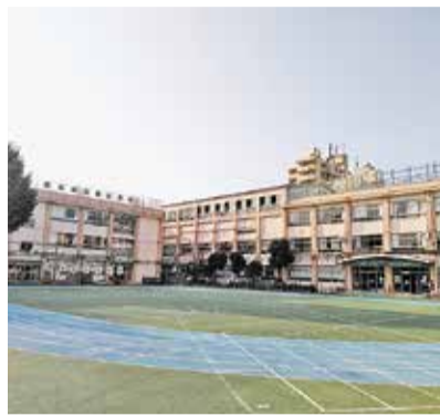
豊島区立要小小学校

問 おもてなしマインドの向上、人材育成の面からも高い効果が期待できる。社会福祉協議会とも協議し、実施に向け検討する。 答 特別支援教育について、学校におけるインクルージョンに関する実践的研究事業の今年度の取組内容は、 問 固定学級と通常学級間の交流や共同学習の充実、児童・生徒一人ひとりの教育的ニーズに応じた支援を継続的に実施するための個別の教育支援計画や個別指導計画の改善を行う。また、要小学校をモデル校に指定し、交流及び共同学習を実践する。 問 今年度の取組を経て、次年度以降の展開は。 答 要小では縦割り班活動や給食交流、共同学習に取り組む予定。来年度は活動のねらいを明確にした交流や共同学習の実践、頻度も増やす準備を行う。 問 従前の取組にICT環境の充実によるツールの強化や要小の研究成果等、新たな要素が加わる。これらを踏まえた特別支