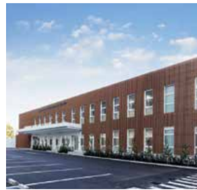
仮設の池袋保健所

17の目標のいずれかに当てはまる。目標に優先順位や重点的な取組は設定せず、既存の施策の中に組み込み具体化していく。 問 新型コロナウイルス感染拡大に伴い働き方が変わってきた。区はテレワークの推進を含め、働き方をどのように変えていくのか。 答 業務の洗い出しや情報セキュリティ等テレワーク推進に係る課題解決に取組み、勤務形態