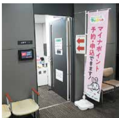
マイナポイント手続き支援窓口

ター等を通じて情報発信を強化するとともに、高齢者や障害のある方には個別対応を行う等、きめ細やかな周知徹底に努める。 問 マイナポイント制度の周知や登録支援による効果は。 答 約2千名の利用があり、啓発の効果が現れている。