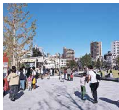
賑わうイケ・サンパーク

問 7月11日にイケ・サンパークの一部がオープン。今後のタイムスケジューリングは。カフェレストランやコトポートの内容は。 答 グランドオープンは12月中旬。11月初旬に東京国際大学の地鎮祭。カフェは運営事業者も決まり準備中。コトポートは9