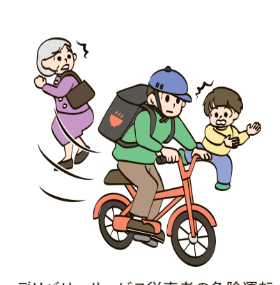
デリバリーサービス従事者の危険運転