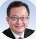
立憲としま 古塚とつひつ