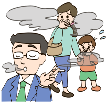
望まない受動喫煙

答 望まない受動喫煙の軽減や環境美化の観点からも、必要と認識している。池袋駅東口五差路の喫煙所は再開すべきと考えが。代替廃止する方向で検討。代替