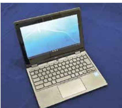
小・中学生に配付したタブレットPC (見本)

を開催。来年度改定予定の行政情報化実施計画に位置づけ、更なる取組を実施する。 ●魅力ある街、安全安心の街整備について 問 分散避難、補助・福祉救援センターや民間施設の活用に関する検討状況と今後の方針は。