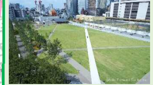
■としまキッズパーク(2020年9月)