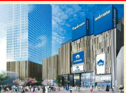
■大塚駅周辺整備(北口) (2021年3月)