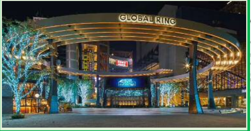
■池袋西口公園 (GLOBAL RING) (2019年11月)