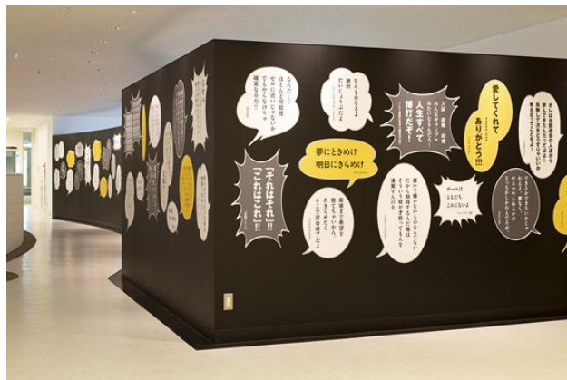
※参考 横手市増田まんが美術館

本事業は、文化庁などが全国展開している「日本博」にエントリーします。日本博は、東京 2020 オリンピック・パラリンピック競技大会を契機として、総合テーマ「日本人と自然」の下に、マンガ・アニメの分野なども含めた「日本の美」を国内外へ発信し、次世代に伝えることで、更なる未来の創生を目指しています。