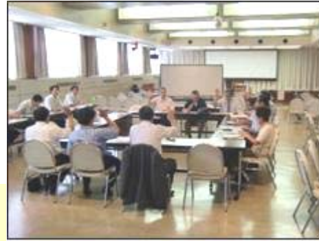
第7回役員会の様子

【日時】平成22年8月27日（金）午後1時半～午後2時 【場所】勤労福祉会館6階大会議室【参加数】11名 【検討内容】会長・副会長の互選について ・会則第9条2項の規定に基づき、役員の間で会長及び副会長の互選を行い、会長及び副会長は、賛成多数により承認されました。