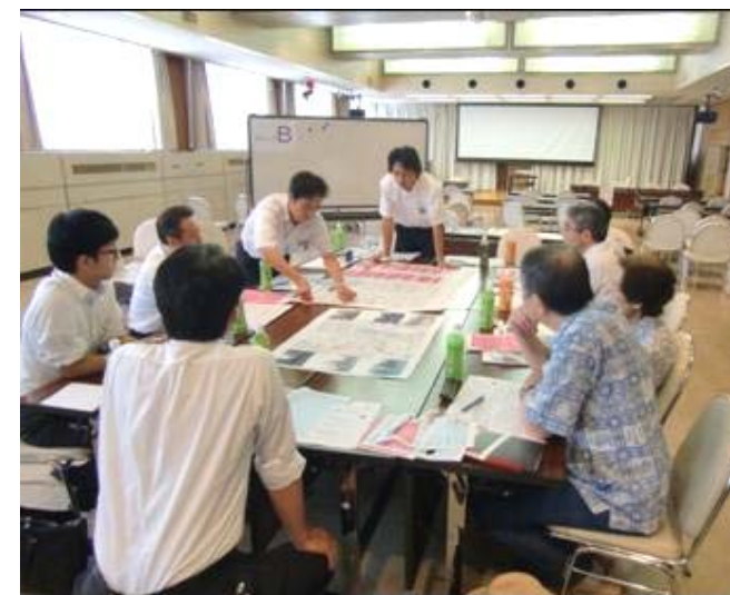
第1回まちづくりワークショップの様子