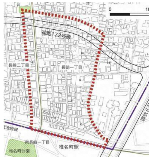
対象区域(椎名町駅北口周辺地区)