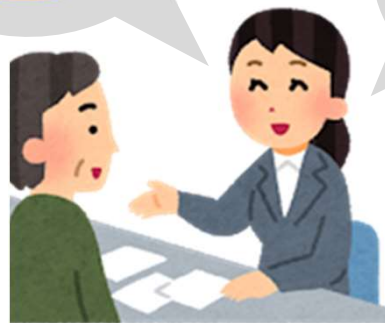
介護サービスの案内